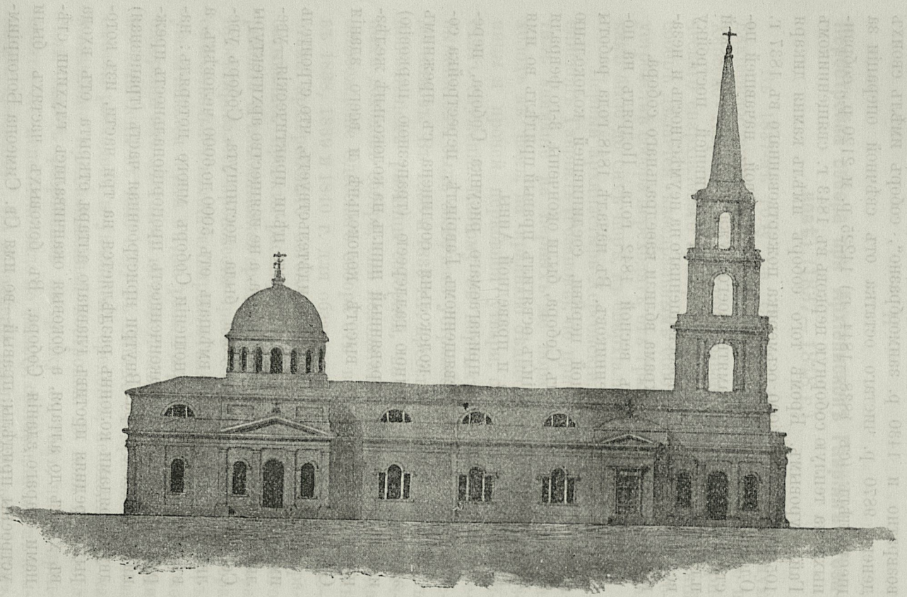
Соборъ послѣ перестройки при Архіепископѣ Гаврилѣ 1848 г.