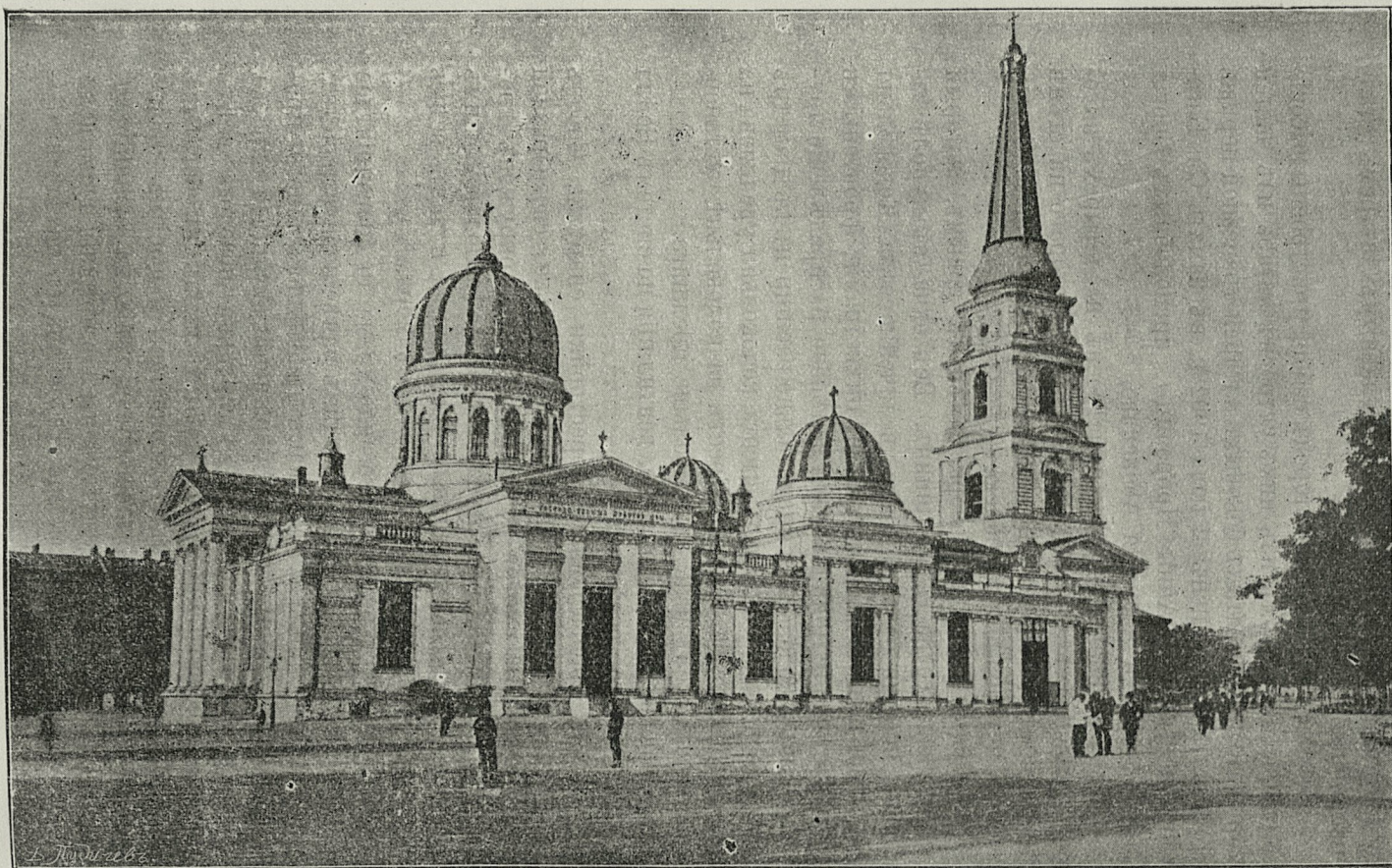
Соборъ послѣ перестрой и при Архіепископѣ Іустинѣ 1900—1903 г.