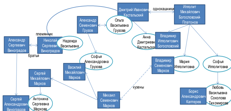
Родственные связи Кастаньских, Грузовых, Виноградовых, Марковых