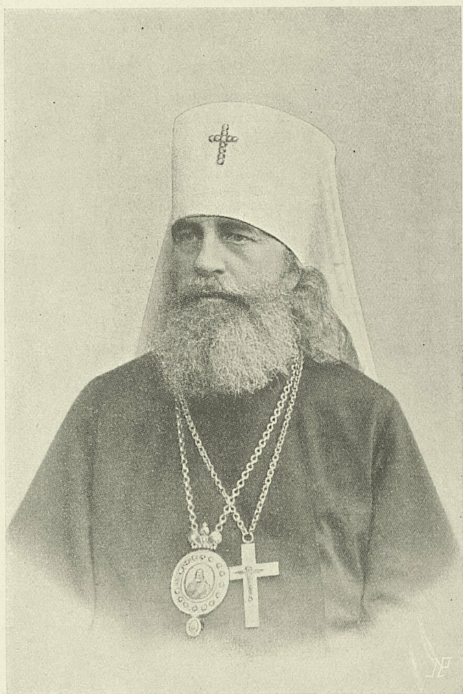
Первенствующій Членъ Святѣйшаго Синода, Высокопреосвященнѣйшій АНТОНІЙ, Митрополитъ С.-Петербургскій и Ладожскій. † 2 Ноября 1912 года.