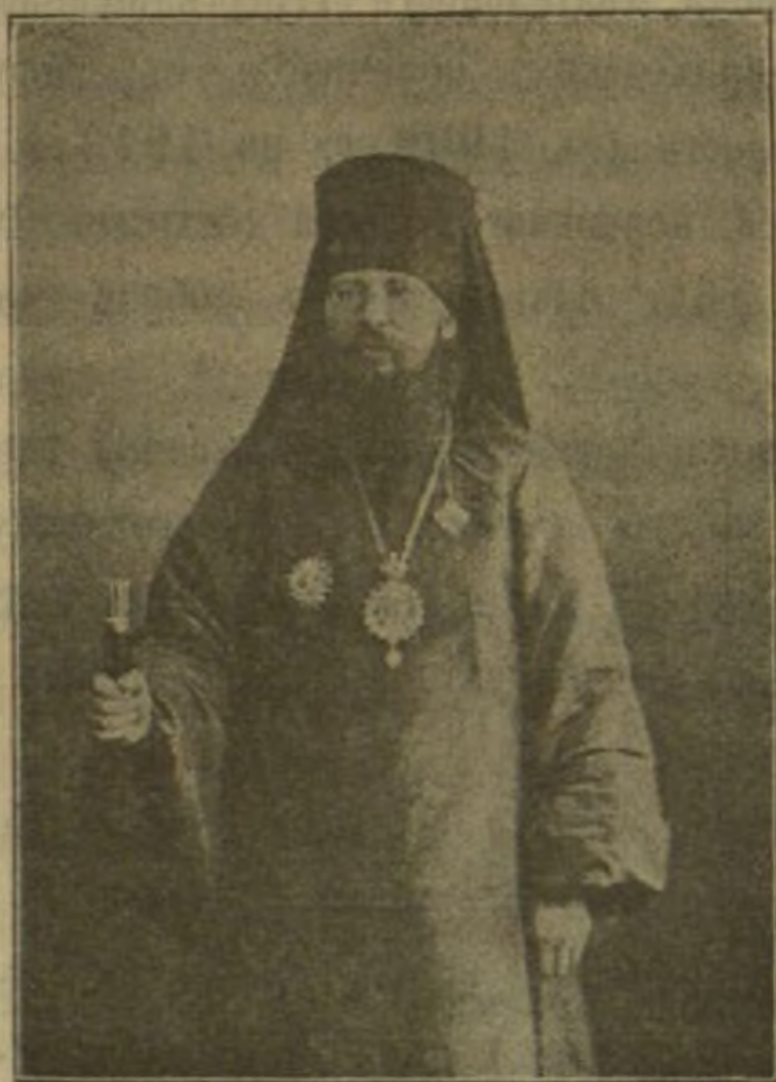
Епископъ Палладій въ 1908 году.

Уставность службы, продолжительность ея, согласованность дѣйствій всѣхъ служащихъ, богатство и красота обстановки храма и богослуженій, стройность цѣннн хора, все это несравнимыя цѣнности для православнаго вѣрующаго человека. И все это онъ въ широкой мѣрѣ находитъ въ служеніи нашего Пермскаго Святителя, Преосвященнаго Епископное пѣніе хора, то убѣждаешься, что здѣсь весь виѣшній строй нашихъ богослуженій подлинно ду оухотворяется, утончается и и всякаго, даже противъ воли его, уноситъ ввысь.