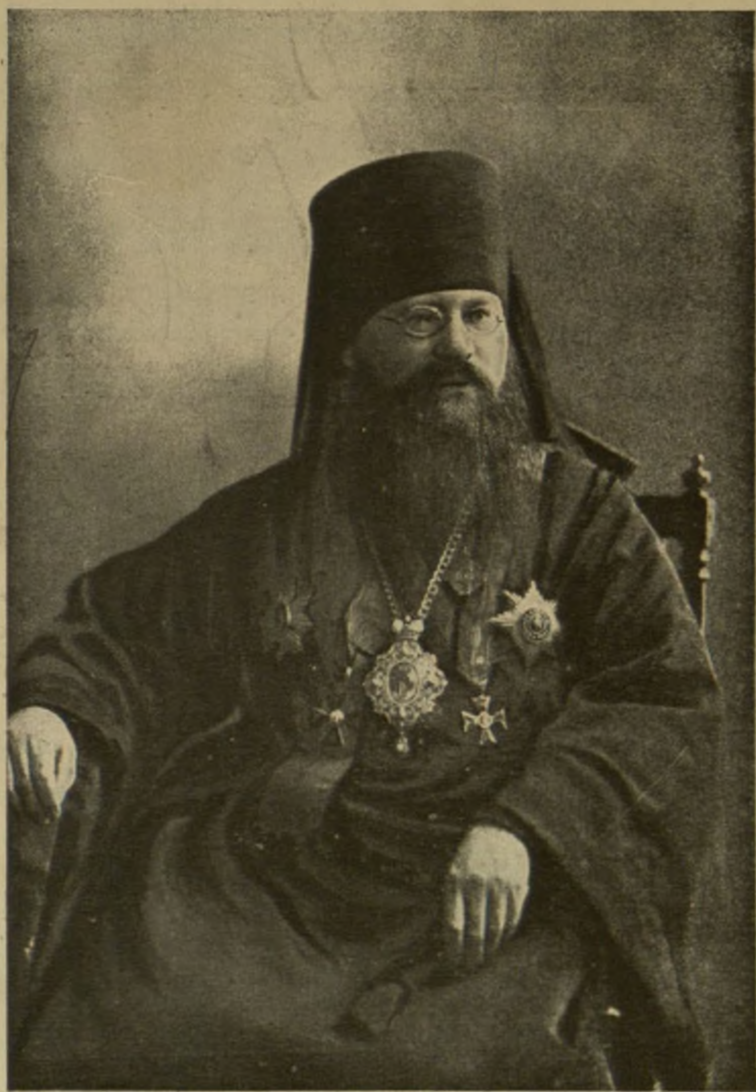
Его Преосвященство, Преосвященнѣйшій Палладій, Епи- скопъ Пермскій и Соликамскій,