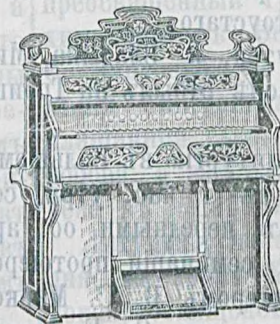
окт., 159 гол., 14 регистръ, ореховаго дер. 200 руб