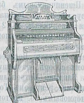
5 окт., 220 гол., 16 регистръ, ореховаго дерева, 250 руб. и дороже.