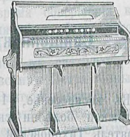
5 окт., 122 голоса, 10 регистръ, дуб. дер. 150 руб. Такая же съ 11 рег. 160 р.