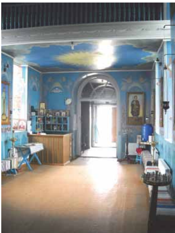
Внутреннее убранство (2012)