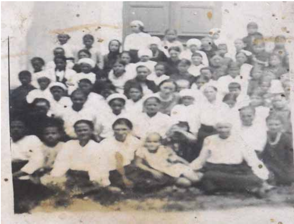
Ученицы кирсовской школы для девочек (1939)