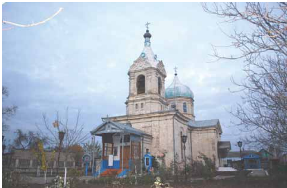
Внешний вид Успенской церкви (2010)