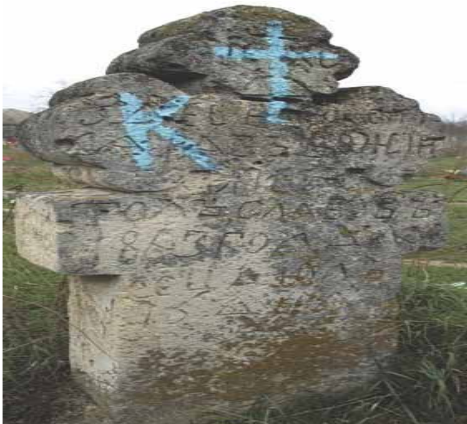
Надгробный крест – расположен на болгарском кладбище (2012)