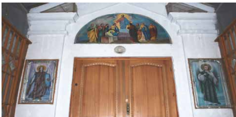
Вход в церковь (2012)