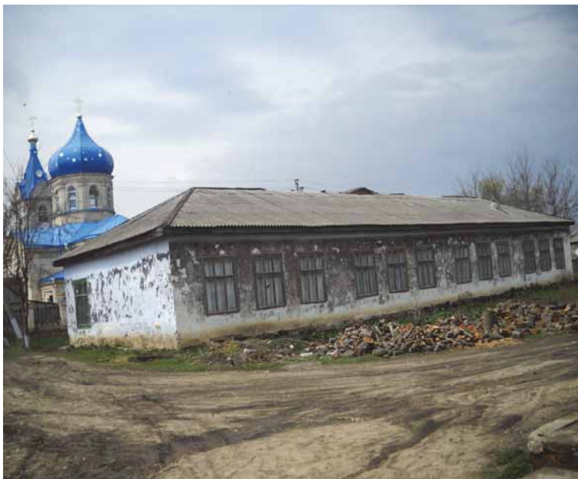
Здание бывшей церковно-приходской школы (2012)