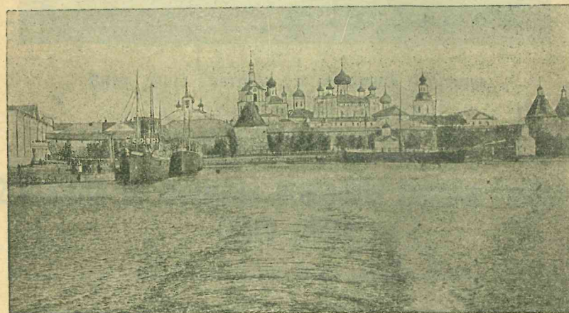
Видъ Соловецкаго монастыря.