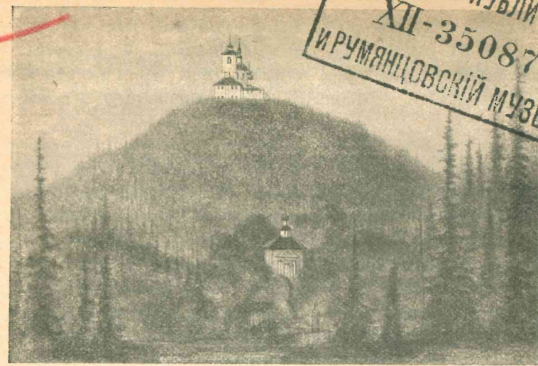
Видъ горы Голговы съ западной стороны.

МОСКОВСКИЙ ПУБЛИЧНЫЙ XII-35087 И РУМЯНЦОВСКИЙ МУЗЕЙ