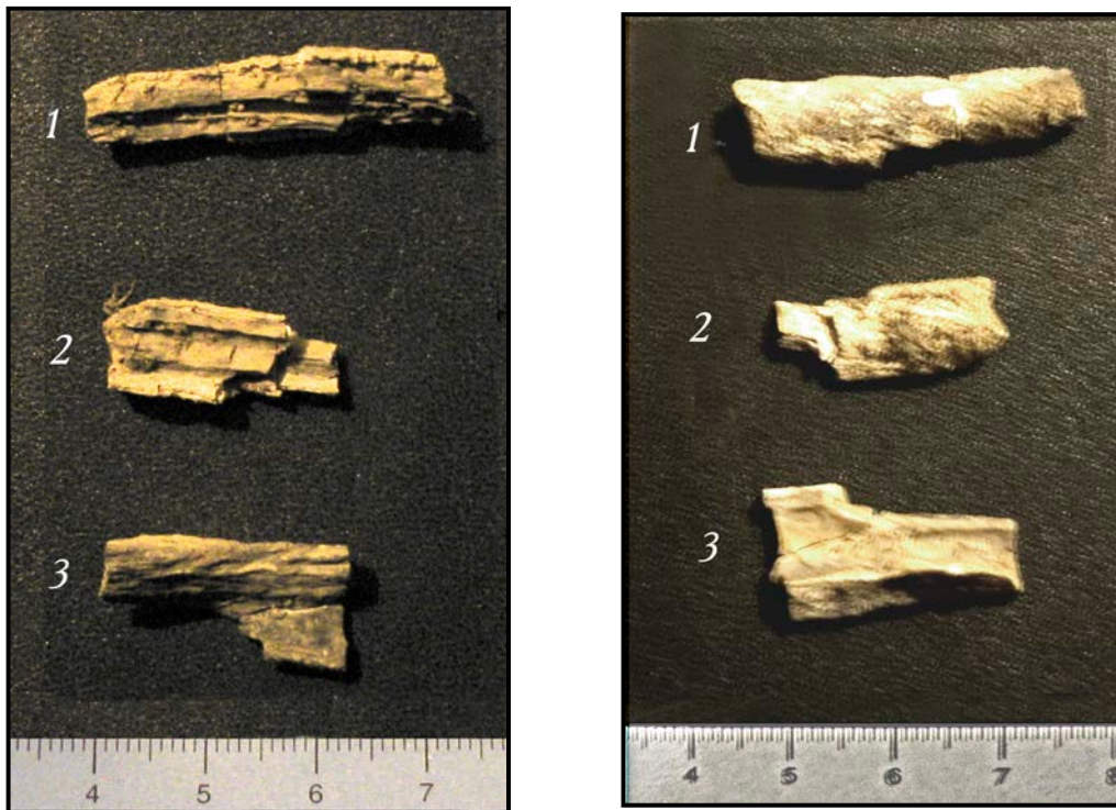
Фрагменты костных останков, обнаруженные на Волкозере в 2004 году. Виды с двух сторон. Материалы Соловецкого отряда МАКЭ.