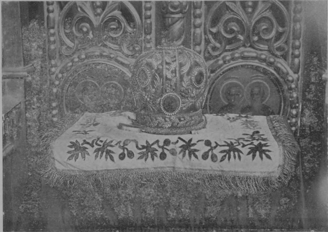
№ 4. Митра.

Митра Святителя Іоасафа. Высота пять вершковъ. Диаметръ основанія—четыре вершка. Цвѣтъ бархатнаго фона— красно-голубой съ зеленымъ оттѣнкомъ . На митрѣ имѣются священныя изображенія, исполненныя масляными красками на холстѣ. Въ центрѣ верха митры—изображеніе Господа Саваоа на облакахъ. Нимбъ треугольный. Правая рука благословляющая. Лѣвая покоится на шарѣ—символъ вседержительства. На концахъ, крестообразно идущихъ чрезъ митру бархатныхъ затканыхъ золотомъ поясовъ, находятся изображенія: Спасителя (на переднемъ концѣ пояса), Богоматери (на лѣвомъ концѣ пояса) и Іоанна Крестителя (на правомъ концѣ пояса). Въ общей сложности изображенія Спасителя, Богоматери и Іоанна Крестителя, находящіяся на митрѣ Святителя Іоасафа, образуютъ иконографическую композицію, известную, подъ именемъ „Деисисъ“ (моленіе). На лицевой сторонѣ митры, выше изображеній Богоматери и Іоанна Крестителя, находятся изображенія двухъ евангелистовъ. Кромѣ двухъ вышеупомянутыхъ поясовъ (одного цвѣта съ фономъ), на митрѣ имѣется третій поясъ, идущій вѣнцомъ внизу надъ основаніемъ митры. Митра заткана золотымъ шитьемъ. На поясахъ вышиты дубовыя листья и цвѣты. Между изображеніями евангелистовъ—колосья. Изображенія стила XVIII вѣка.