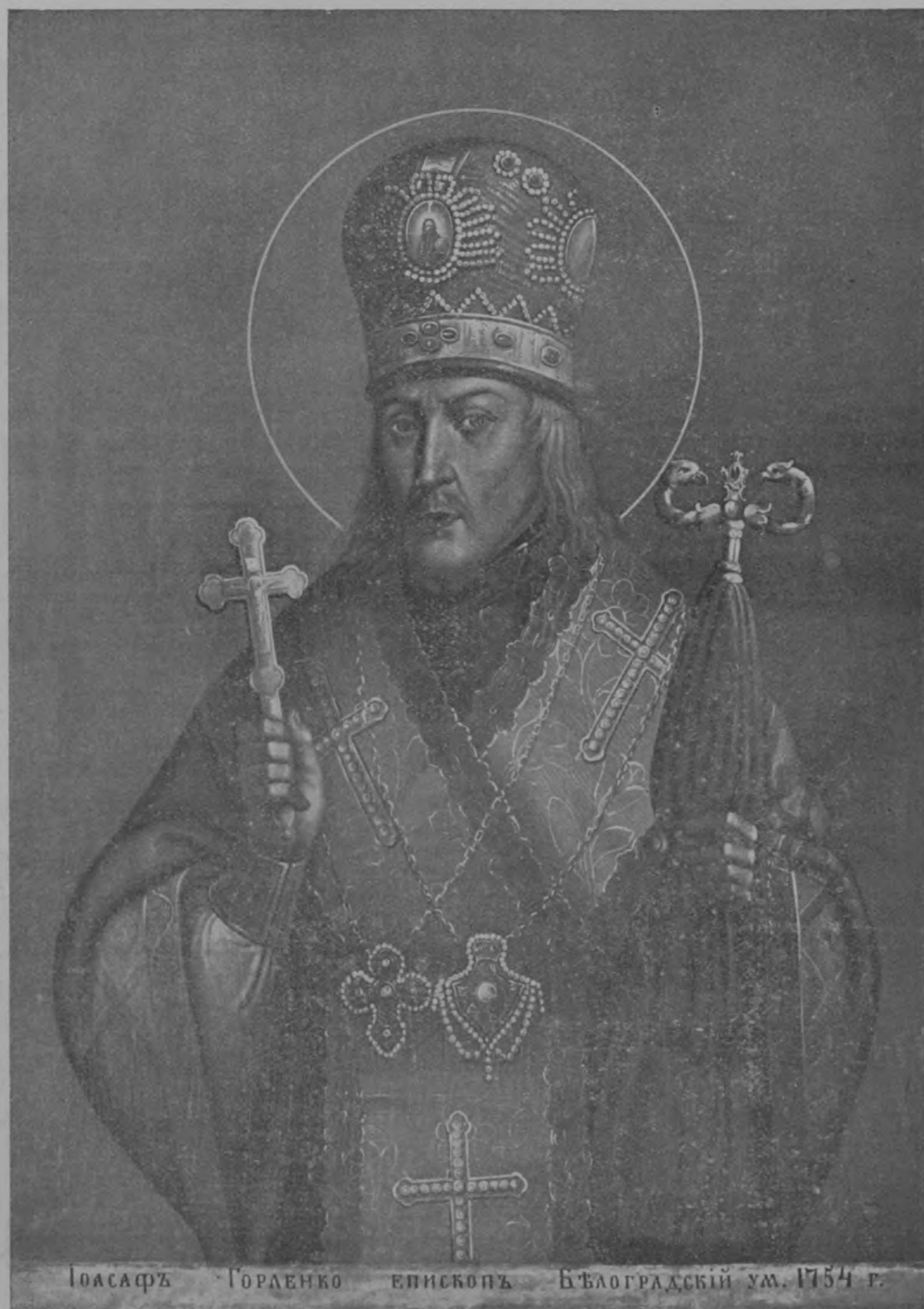
№ 1. Кіевскій Академическій портретъ Св. Іоасафа.