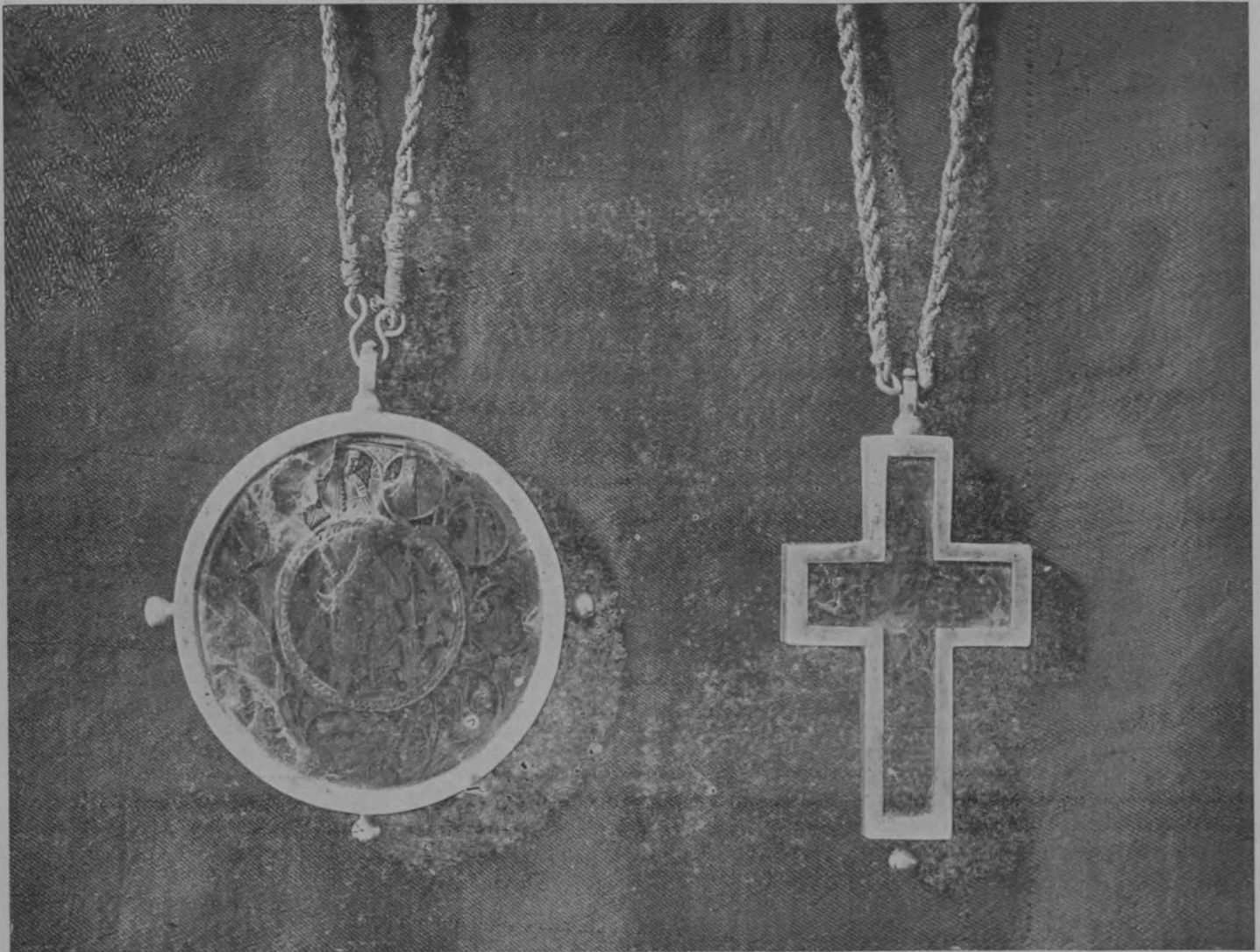
№ 3. Крестъ и панагія (оборотная сторона).

Архіерейскій крестъ Святителя Іоасафа—четвероконачный, деревянный, рѣзной въ серебряной оправѣ—рамкѣ. По характеру крестъ однороденъ съ описанною выше панагією. Рѣзба покрыта слюдой. Въмѣсто цѣпочки—золоченый шнуръ. Высота креста полтора вершка. Ширина поперечнаго древа креста—одинъ вершокъ. Толщина креста—одна четверть вершка. Длина шнура—одиннадцать вершковъ. Рѣзба отличается такими же выдающимися качествами, какъ и на вышеописанной панагіи. Содержаніе священныхъ изображеній, помѣщенныхъ на архіерейскомъ крестѣ Святителя Іоасафа таково. На лицевой сторонѣ въ средней части креста находится рѣзное изображеніе распятія съ предстоящими Божією Матерію и апостоломъ Іоанномъ Богословомъ. Въ правой части поперечнаго древа креста—равноапостольные Константинъ и Елсн. Въ лѣвой части—неизвѣстная святая. Въ нижней части лицевой стороны креста—изображеніе святого, повидимому евангелиста. Въ верхней части—изображеніе неизвѣстнаго святого съ книгой въ рукѣ. На оборотной сторонѣ креста въ средней его части находится рѣзное изображеніе Божіей Матери, сидящей на тронѣ съ Богомладенцемъ на рукахъ. Изображеніе—западнорусскаго характера. По сторонамъ Богоматери—ангелы съ распростертыми крыльями. Въ верхней и нижней частяхъ оборотной стороны креста находятся изображенія царственныхъ людей. Въ верхней части находится изображеніе неизвѣстнаго святого мужа въ царскомъ вѣнцѣ со свиткомъ въ десницѣ. Въ нижней части—изображеніе святого юноши въ царской діадемѣ, съ гусями—псалтирю ( Царь Давидъ ).