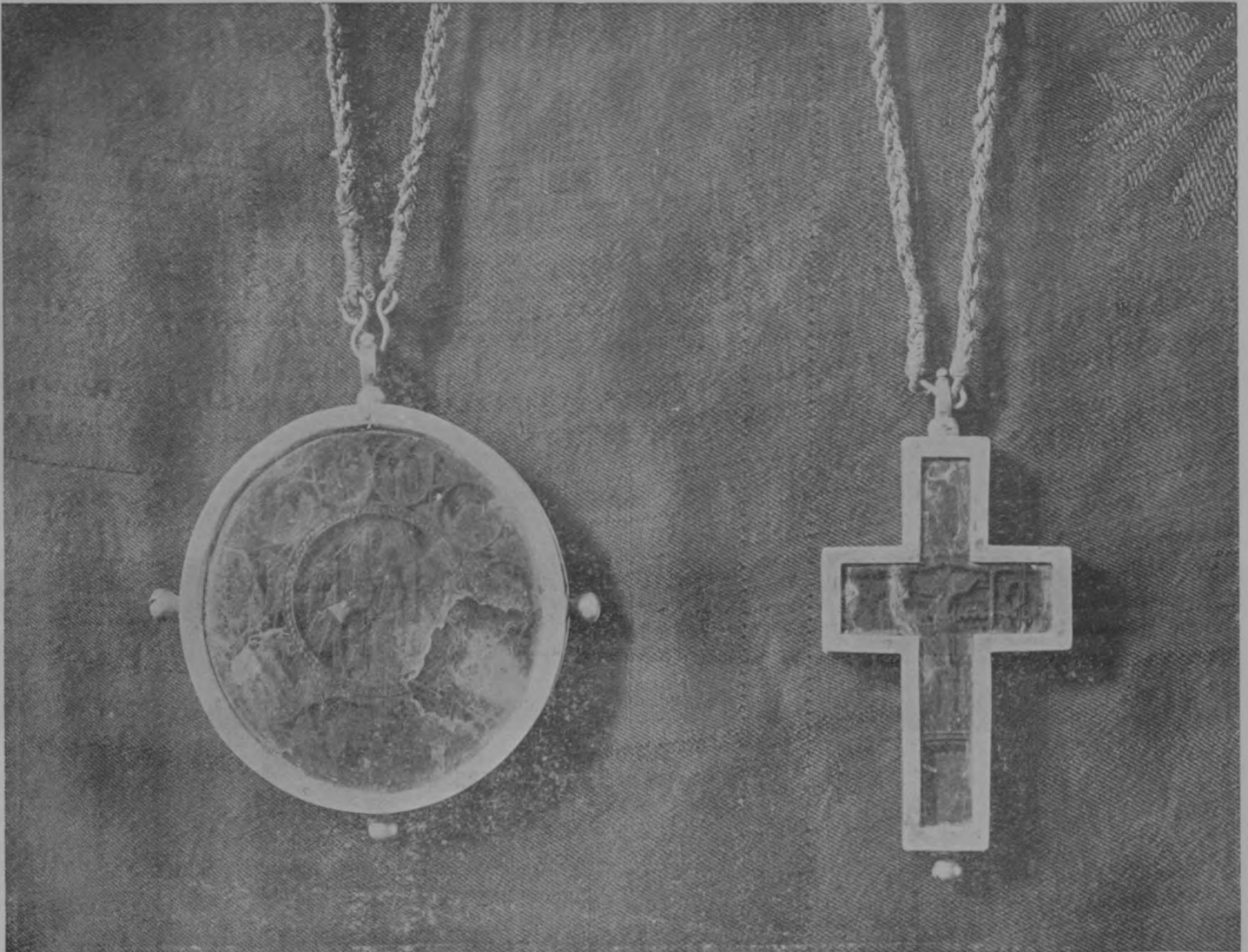
№ 2. Крестъ и панагія (лицевая сторона).

Сохранились неизлѣвными все облаченія, начиная съ митры, бывшія на Святителѣ отъ дня его погребенія, кромѣ правой поручи, чулочковъ и туфелекъ, которые въ разное время были замѣнены новыми. Поэтому иконописцы, изображая Святителя по Кіевскому портрету, въ то же время должны: панагію и крестъ изображать тѣ, какія найдены находившимися при освидѣтельствovanіи святыхъ мощей на Святителѣ. Облаченія же должны быть писаны при этомъ тѣхъ рисунковъ, какіе на подлинныхъ. Далѣе на снимкахъ и прилагаются эти изображенія съ пояснительно-дополнительнымъ текстомъ къ нимъ изъ книжки специально облѣдовавшаго эти облаченія г. Г. И. Булгакова съ нужными дополненіями. Снимки сдѣланы подъ наблюденіемъ Преосвященныхъ Викаріевъ мѣстнымъ Бѣлгородскимъ фотографомъ Борковскимъ. Вотъ эти облаченія.