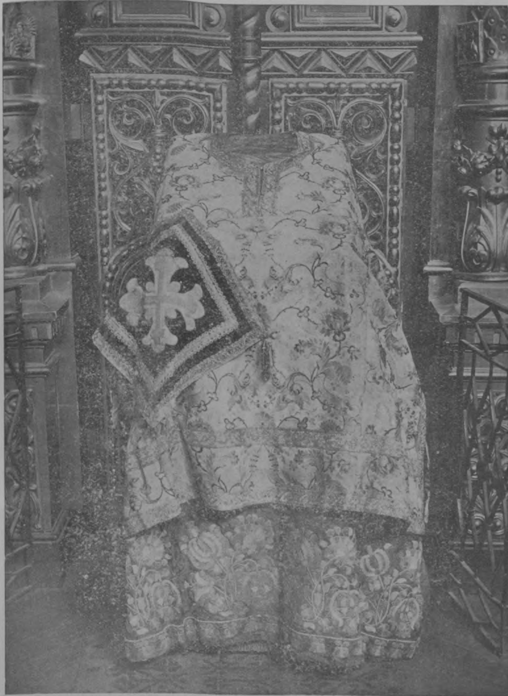
№ 6. Палица, саккосъ, подризникъ

Палица Святителя Иоасафа—бархатная, квадратная. Въ длину и въ ширину имѣеть девять съ четвертью вершковъ. Цвѣтъ блдно-зеленый. На палицѣ нашитъ крестъ четвероконечный ( 5\frac{1}{2} \times 5\frac{1}{2} вершковъ).