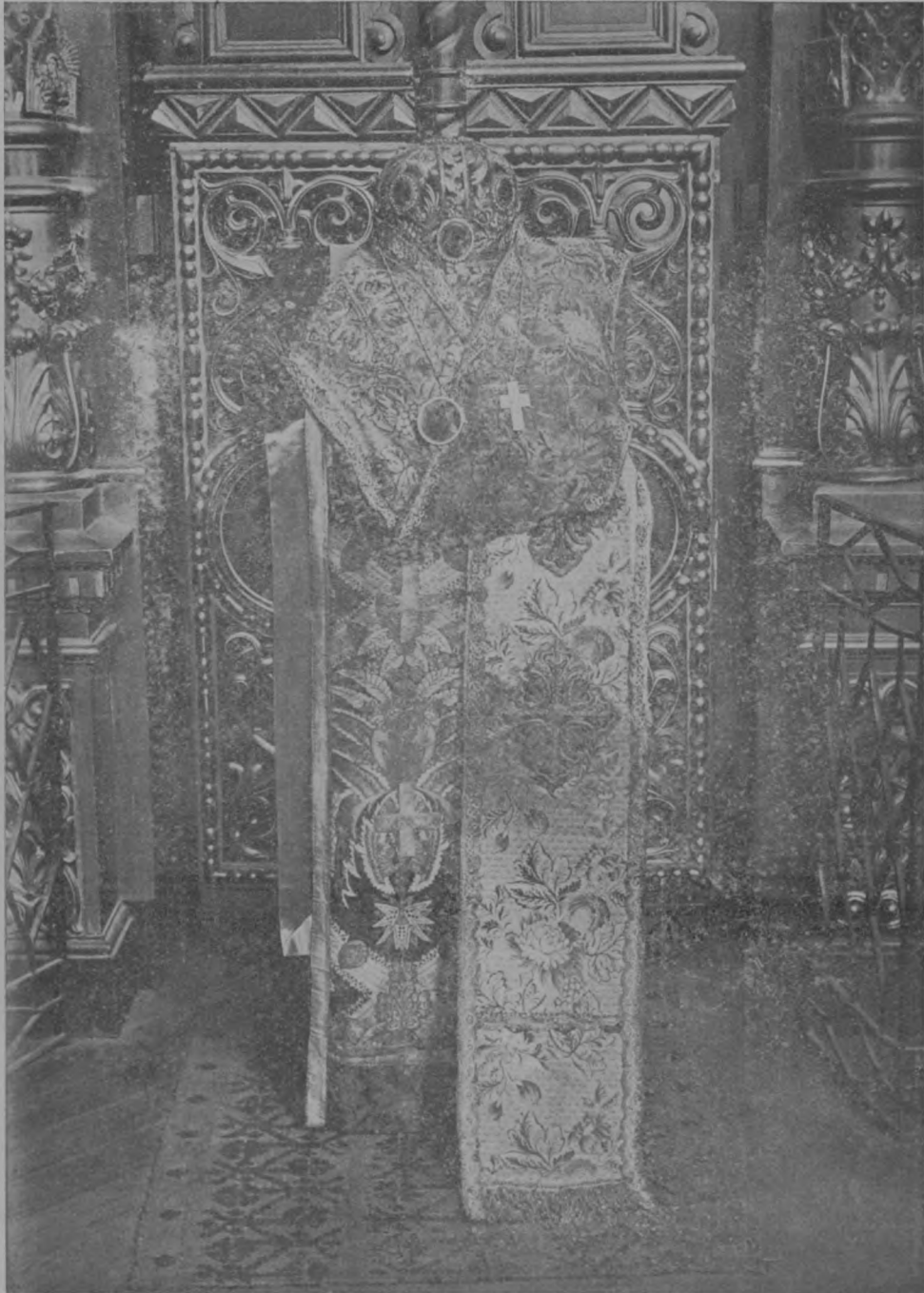
№ 5. Омофоръ и епитрахиль.

Омофоръ Святителя Иоасафа въ длину имѣетъ шесть съ половиною аршинъ, а въ ширину шесть съ четвертью вершковъ. Фонъ— блдно-свѣтло коричневый . Затканъ цвѣтами, листьями и стеблями. Листья бѣлые съ коричневыми жилками . Цвѣты малиновые и фіолетовые . На омофорѣ нашиты три креста. Фонъ этихъ крестовъ изъ малиноваго бархата . На фонѣ вышиты золотомъ четвероколенные кресты (съ развѣтвленіями на концахъ) . По краямъ омофора— газовая серебрянная сѣтка , нашитая на розоватую шелковую кайму .