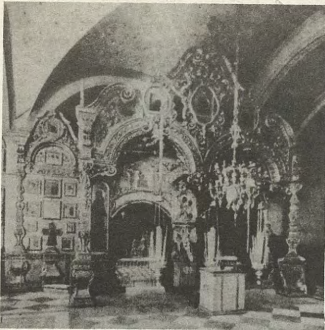
Рака съ мощами преподобныхъ основателей Соловецкаго монастыря въ Троицкомъ соборѣ.