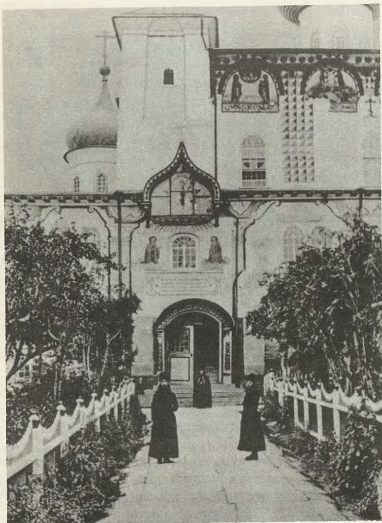
Соловецкіе монахи у входа въ Преображенскій соборъ съ чудотворной Знаменской иконой Божіей Матери.

Особенно трудно приходилось регентамъ весной, когда до половины состава хора мѣнялось.