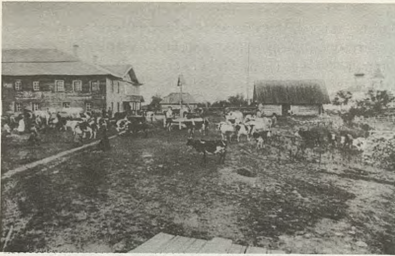
Сергіевскій скитъ и при немъ скотный дворъ.

Заяцкаго острова. Владѣлецъ отказался отъ судна, передавъ его монастырю. Тогда монахи привезли на отливѣ къ кораблю бочки, закрѣпили ихъ соотвѣствующимъ образомъ, а съ приливомъ корабль приподнялся. Затѣмъ его отбуксировали въ Архангельскъ.