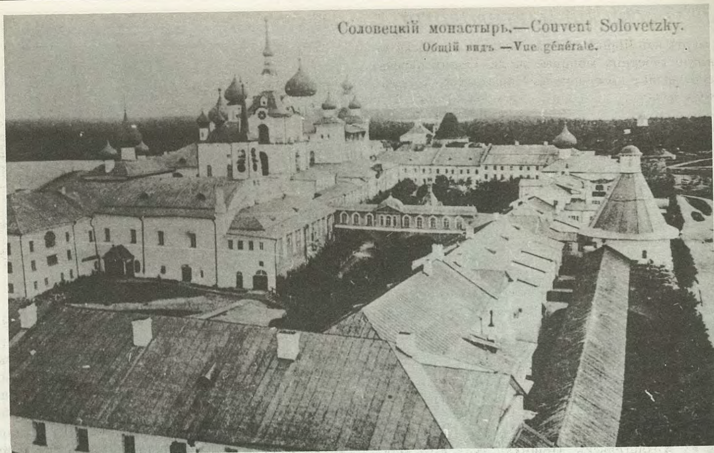
Панорама монастыря какъ было до революціи.