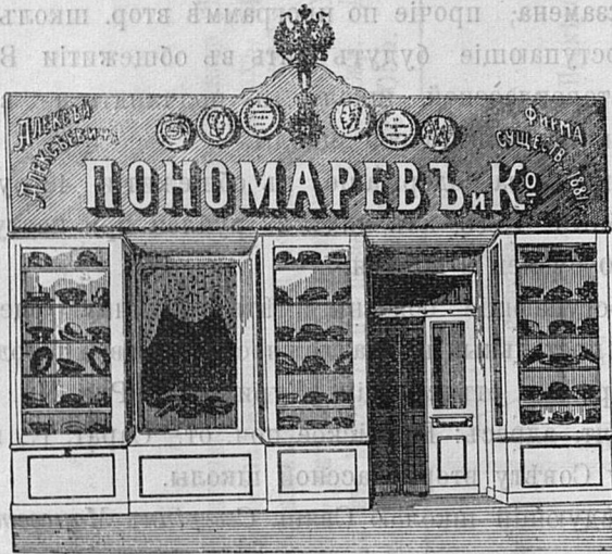
Саратовъ, Никольск. ул. д. Лютеранской церкви.

Принимаются ЗАКАЗЫ на Камилавки и Скуфьи.