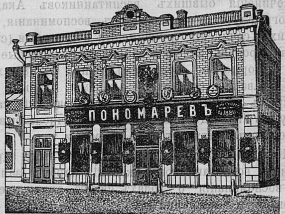
Самара, Лворянская ул. д. Лютеранской церкви.

Принимаются ЗАКАЗЫ на Камилавки и Скуфьи.