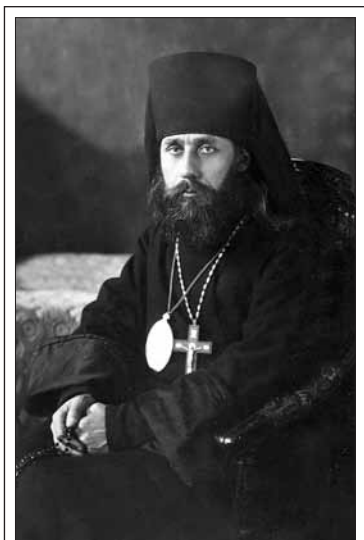
Аркадий, епископ Лубенский, викарий Полтавской епархии

Епископ уехал в Новофонский монастырь на Кавказе, жил в горах, встречался с подвижниками, которые населяли в то время пропасти и ущелья Кавказских хребтов. Но и здесь положение было беспокойным, власти предпринимали меры к аресту монахов, с помощью охотников выслеживали их, арестовывали и расстреливали. Осознавая, что в любой момент он может быть также убит, епископ носил под подкладкой сапога свою фотографию, чтобы в случае смерти люди могли узнать о его участи.