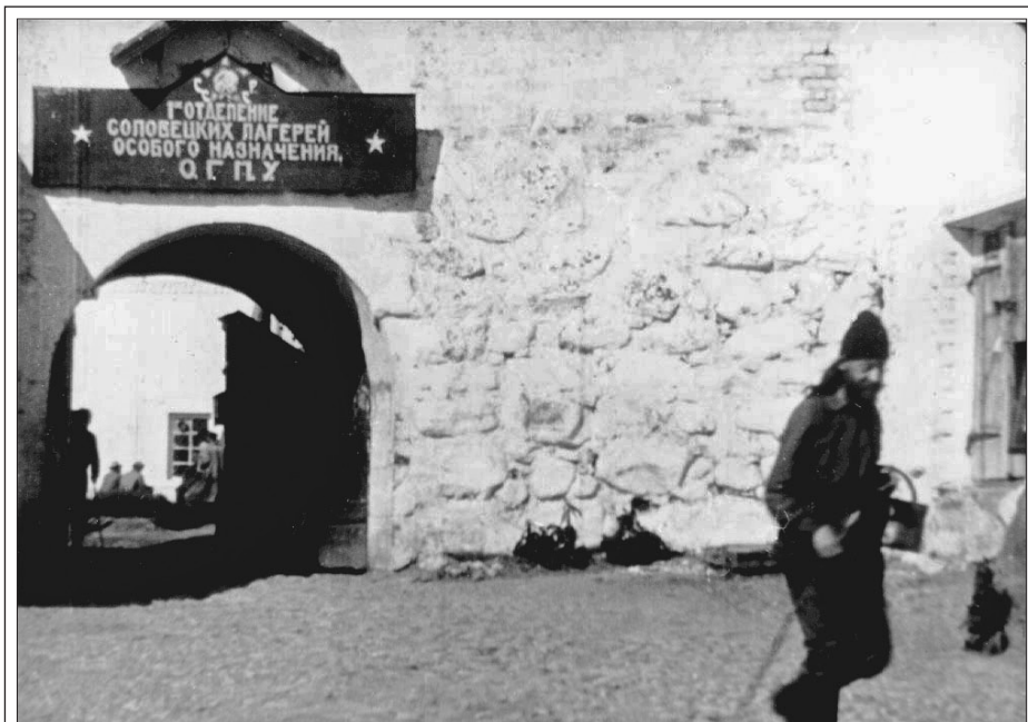
Соловецкий концлагерь. 1929 год

12 августа преосвященный Аркадий прибыл в Соловецкий концлагерь и был определен в 11-ю роту на самую тяжелую работу. 10 сентября епископа перевели в 12-ю роту и назначили сторожем, 16 сентября перевели в 6-ю роту. Сторожем епископ прослужил до 9 мая 1929 года, когда его снова отправили на общие работы – рытье дренажных колодцев. В июне 1929 года епископа