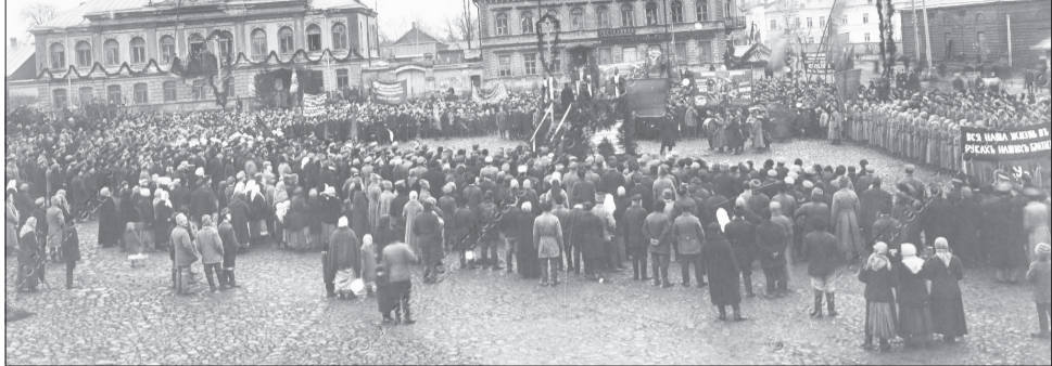
Демонстрация, посвященная 1-й годовщине октябрьской революции.