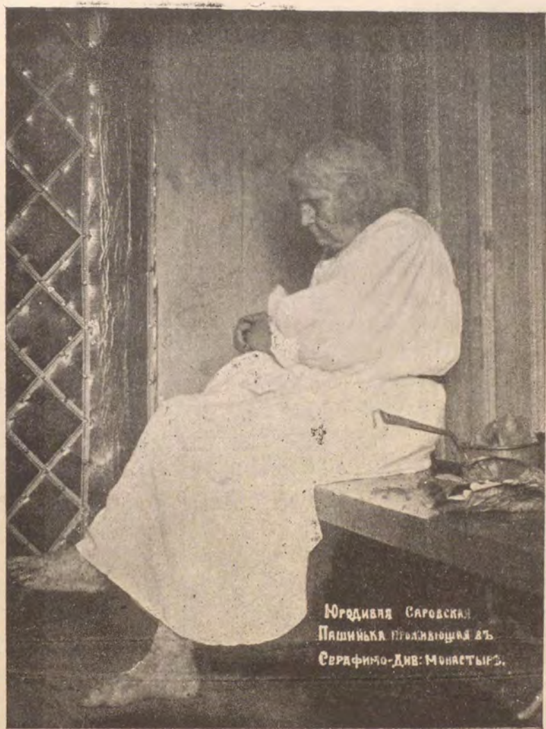
Юрдивля Саровская Пашинька пролившая в Серфимо-Див. монастыре.