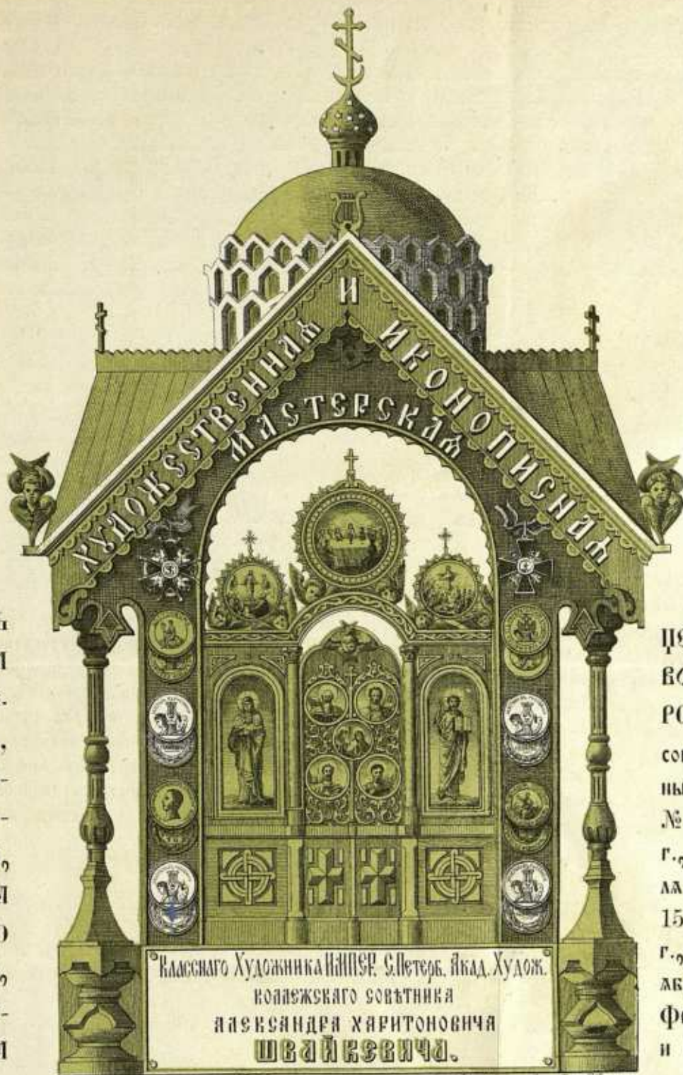
Изготовилъ въ Одессѣ Ф. Швайкевичъ. Художникъ и Скульпторъ. 1886 г. Метрополитанъ. Литографъ

ОТКРЫТА СЪ БЛАГОСЛОВЕНІЯ ВЫСОКОПРЕ- СЛАВНАГО АРХИ- ЕПИСКОПА ОДЕССКАГО, СЪ ЦѢЛЮ РЕ- ГУЛИРОВАНІЯ