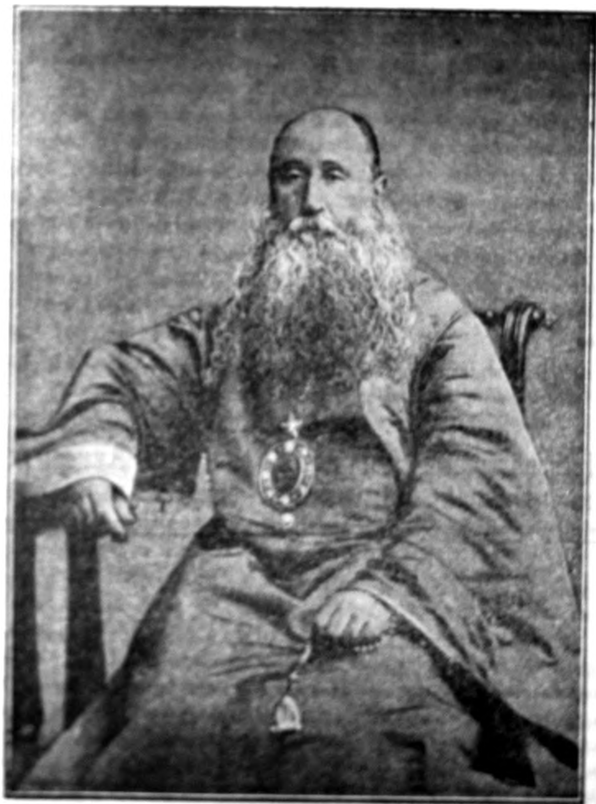
Comte de Argyr.