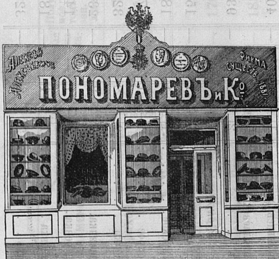
Саратовъ, Никольск. ул. д. Лютеранской церкви.

для священниковъ въ большомъ выборѣ шляпы, шапки ЦѢНЫ НЕДРОГОЯ.