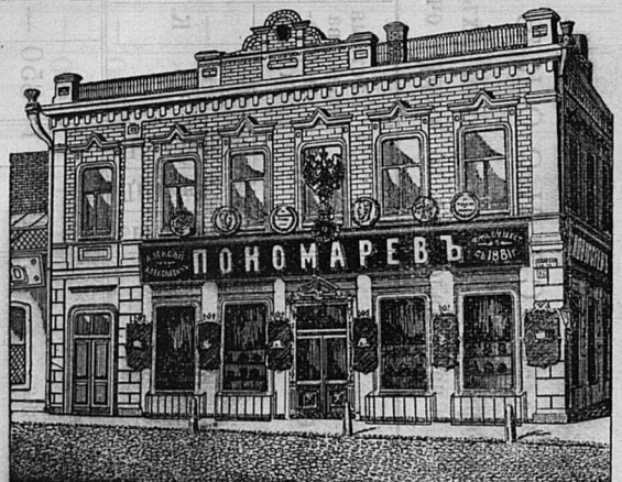
Самара, Дворянская ул. д. Лютеранской церкви.

Принимаются ЗАКАЗЫ на Камилавки и Скуфьи.