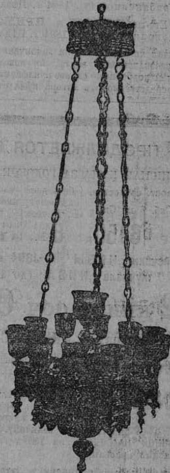
ЛАМПАДА бронзовая, эмаль- оченная, съ эмалевыми украш., сблани- ная въ Афонскую часов. съ великомуч. Павтлемеона, находниц. въ г. Москвѣ.

Иллюстрир. прейсъ-курантъ по требов. высыл. бесплатно.