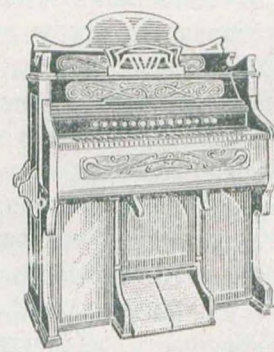
5 окт., 220 гол., 16 регистръ, орѣховаго дерева. 250 руб.