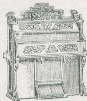
5 окт., 122 гол., 13 регистръ, орѣховаго дер. . . 180 руб. 5 окт., 159 гол., 14 регистръ, орѣховаго дер. . . 200 руб.