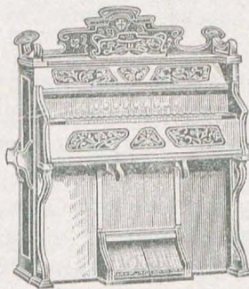
5 окт., 122 гол., 13 регистр., орѣховаго дер. . . 180 руб. 5 окт., 159 гол., 14 регистр., орѣховаго дер. . . 200 руб.