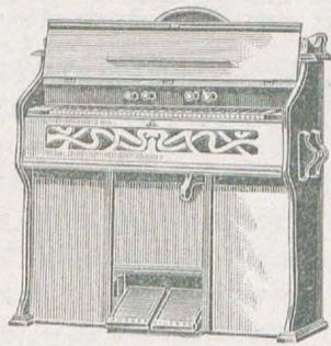
5 октавъ, 61 голосъ, 5 регистр., дуб. дерева. 120 руб.

ПЕРВОКЛАССНЫХЪ ЗАГРАНИЧНЫХЪ ФАБРИКЪ КАРПЕНТЕРЪ, ШИДМАЙЕРЪ и СОБСТВЕННОЙ ФАБРИКИ ВЪ ЛЕЙПЦИГѢ (АМЕРИКАН. СИСТЕМЫ).