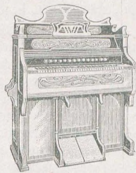
5 окт., 220 гол., 16 регистр., орѣховаго дерева. 250 руб.