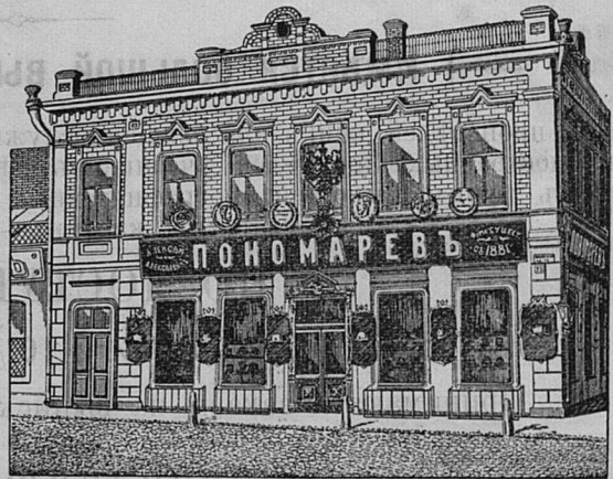
Самара, Дворянская ул. д. Лютеранской церкви.

Принимаются ЗАКАЗЫ на Камилавки и Скуфы.