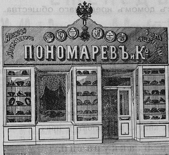
Саратовъ, Никольск. ул. д. Лютеранской церкви.

Принимаются ЗАКАЗЫ на Камилавки и Скуфы.