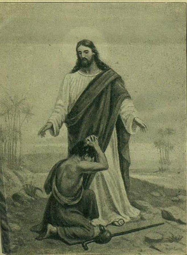
Придите ко Мнѣ, всѣ труждающіеся и обремененныя. (Матѣ. XI. 82.—Съ картины художн. Лунда).

Открыта подписка на 1907 г., изд. XXII г.