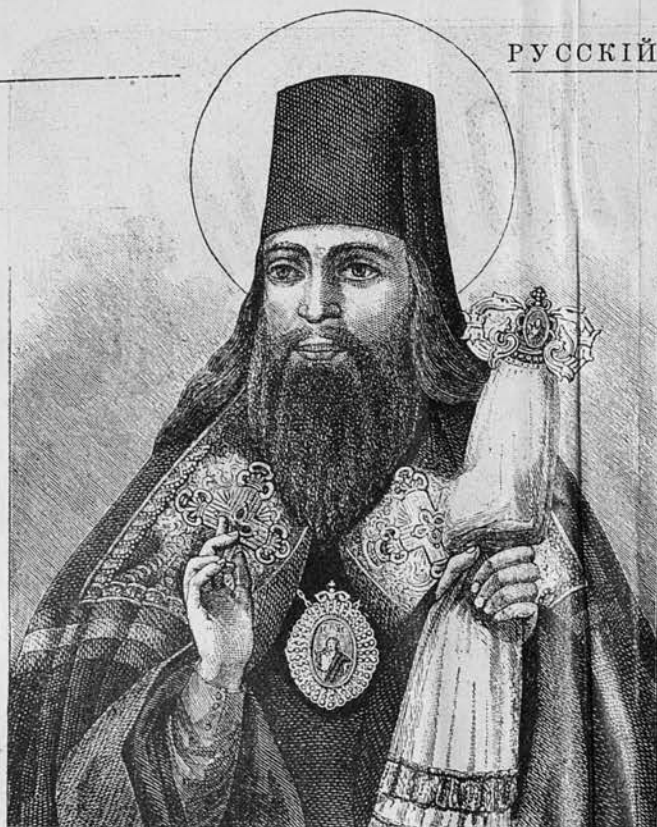
Св. Тихонъ Задонскій, епископъ Воронежскій. († 13 августа 1783 года).

Съ Божіею помощію „Русскій Паломникъ“ вступаетъ въ двадцать второй годъ изданія. Срокъ немалый и вполне достаточный для того, чтобы судить, насколько наше изданіе, руководящее христіанна въ вопросахъ вѣры и благочестія, удовлетворяетъ научной потребности православно-русскихъ читателей.