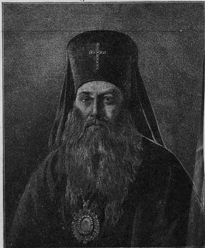
Преподобный Иннокентій, архіепископъ Херсонскій. († 26 мая 1857 года).