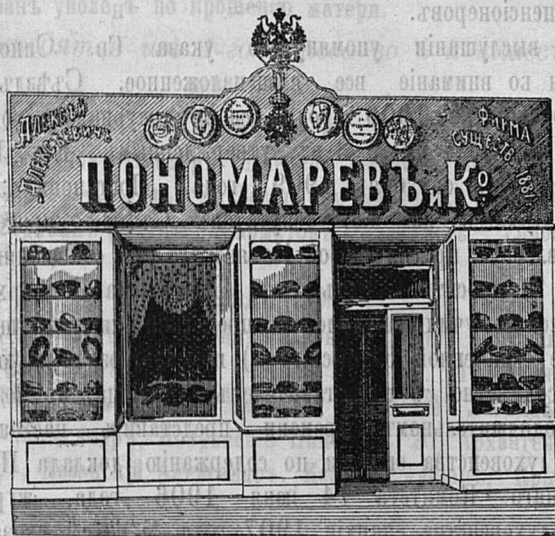
Саратовъ, Никольск. ул. д. Лютеранской церкви.

для священниковъ въ большомъ выборѣ шляпы, шапки цѣны недорогія.