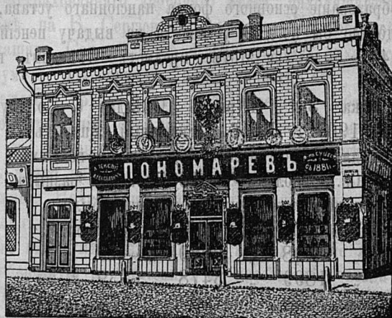
Самаръ, Дворянская ул. д. Лютеранской церкви.

Принимаются ЗАКАЗЫ на Камилавки и Скуфы.