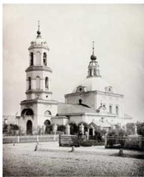
Церковь Николы в Кобыльском