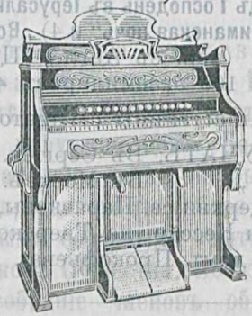
5 окт., 220 гол., 16 регистр., орховаго дерева. 250 руб. и ороже.