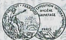
Парижъ 1904 г.