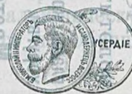
Серебрян. медаль 1901 г.

Поставщикъ Двора Его Императорскаго Величества