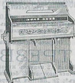
5 окт., 122 голоса, 10 регистр., дуб. дер. 150 руб. Такая же съ 11 рег. 160 р.