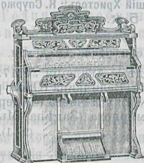
окт., 159 гол., 14 регистр. орховаго дер. . . 200 руб