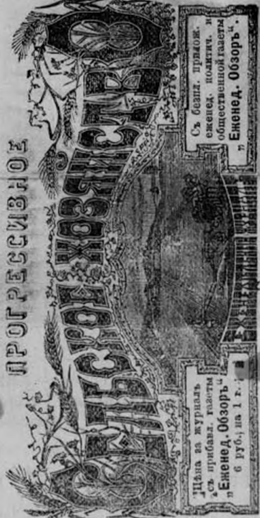
Цифра за журнал... Енед. Обзоръ ч. 6 руб. на 1 г.