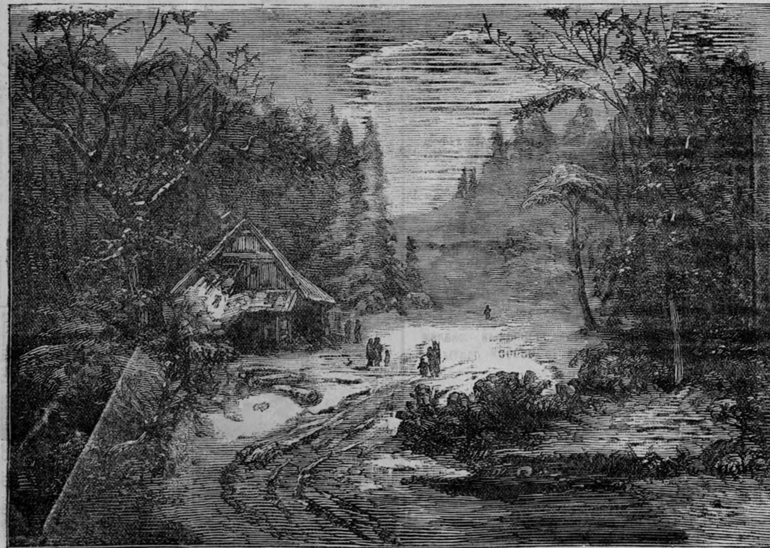
Пейзажъ — «КУЗНИЦА ВЪ ЛѢСУ». Ширина 16 вер. Высота 12 вершк. Продажная цѣна 4 р.