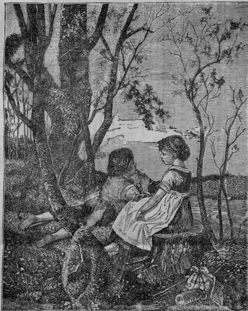
Сельская сцена — «ЮНЫЕ МЕЧТАТЕЛИ». Ширина 9 \frac{3}{4} вер. Высота 12 \frac{1}{4} вершк. Продажная цѣна 4 р.