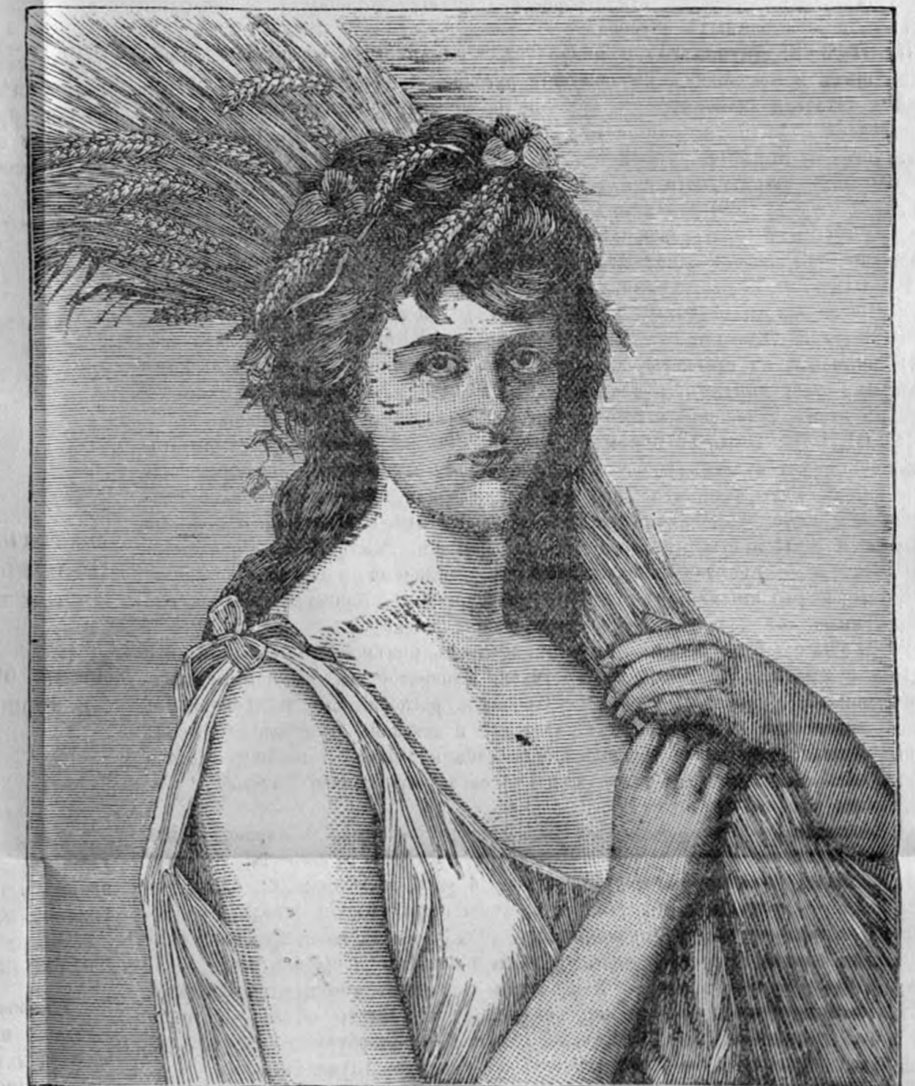
Женская головка — «РУФЬ». Ширина — 10 \frac{3}{4} верш. Высота 13 \frac{1}{4} вершк. Продажная цѣна 4 р.

Художественное и великолѣпное исполненіе этихъ картинъ во всемірно-извѣстныхъ олеографическихъ заведеніяхъ Вирта и Овена въ Нью-Йоркѣ, не даетъ возможности отличить ихъ отъ картинъ писанныхъ масляными красками ручнымъ способомъ, вслѣдствіе чего онѣ могутъ служить лучшимъ украшеніемъ любой гостиной.