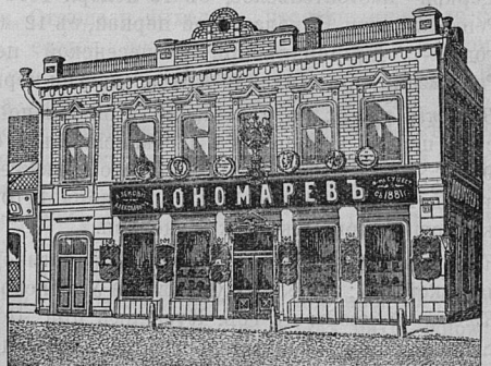
Самара, Дворянская ул. д. Лютеранской церкви.

Принимаются ЗАКАЗЫ на Камилавки и Скуфы.