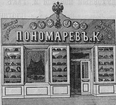
Саратовъ, Никольск. ул. д. Лютеранской церкви.

Принимаются ЗАКАЗЫ на Камилавки и Скуфы.