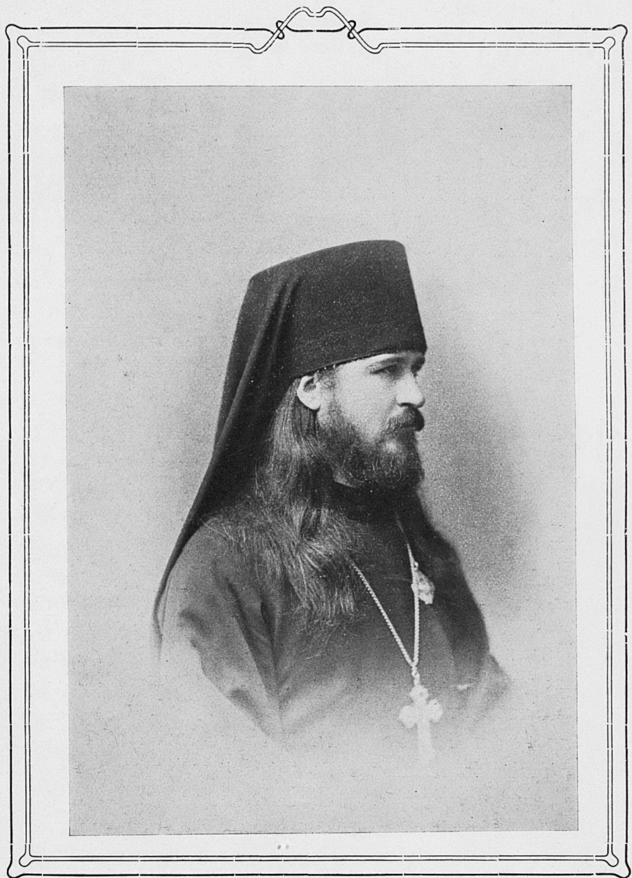
Пресвященный ПРОКОПІЙ, Епископъ Елисаветградскій.