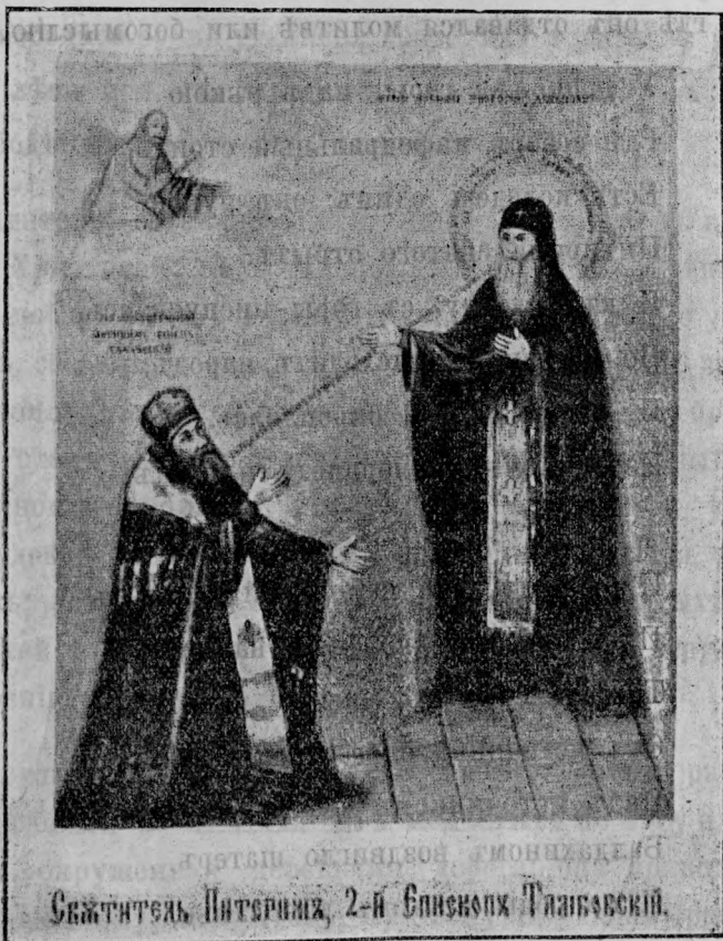
Святитель Питиримъ, 2-й Епископъ Талызскій.

Отець бо единъ всѣмъ, помяни душу его и сподоби его царствія небеснаго». Молитва эта написана вокруг головы преподобнаго. Наверху картины, надъ святителемъ Питиримомъ изображенъ самъ Господь, который шлетъ на главу его свое благословеніе. Трогательна эта картина, ибо она изображаетъ и постоянное молитвенное обращеніе