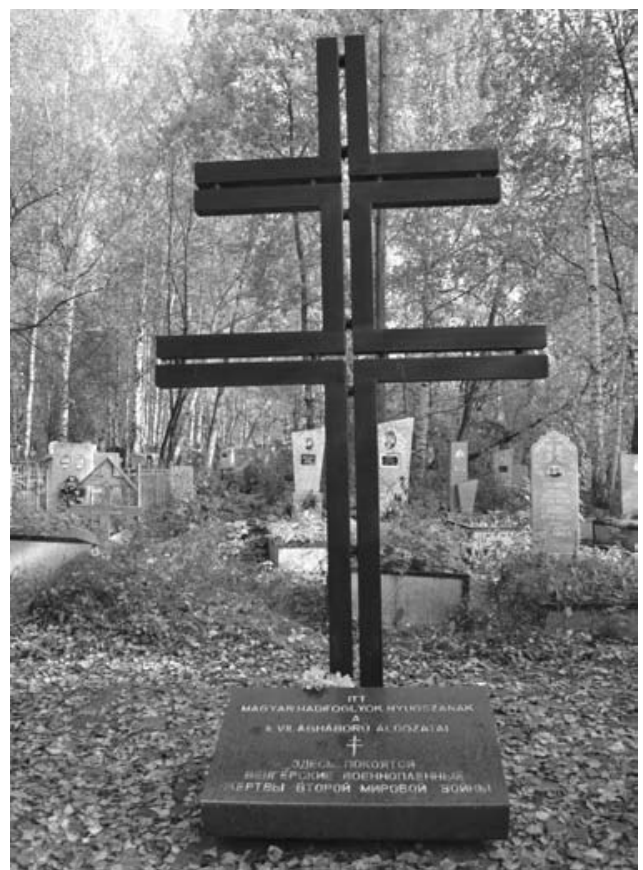
Памятный знак на могиле венгерских военнопленных.