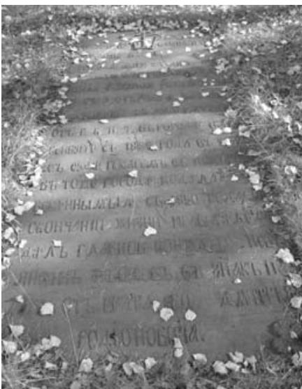
Надгробная плита на могиле Р.Е.Сухарева.