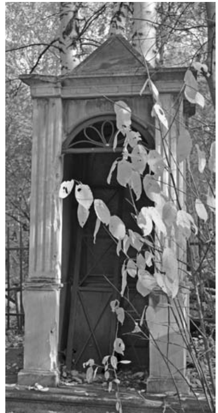
Надгробия на могилах купцов Богомоловых.