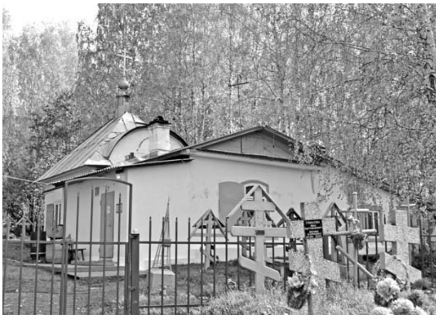
Крестовоздвиженская старообрядческая часовня.

На территории кладбища, перед Крестовоздвиженской часовней (чуть левее), находилась ещё