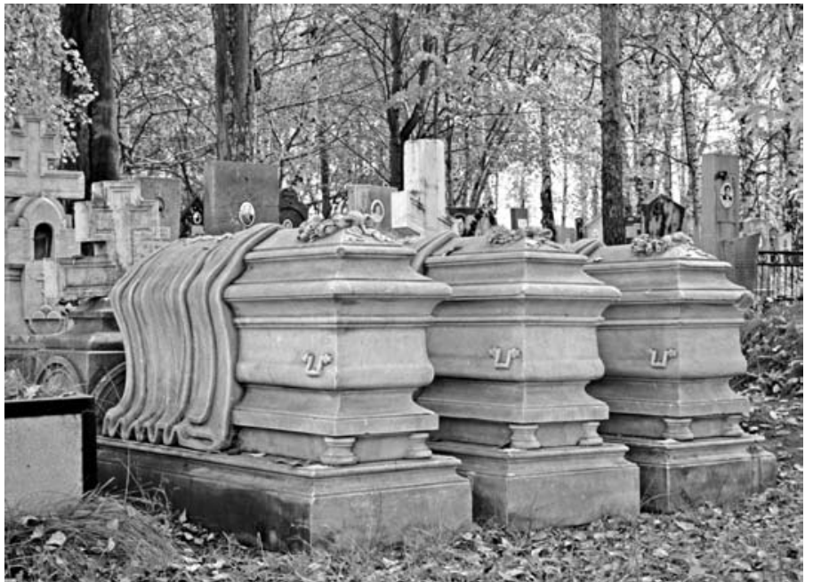
Надгробие на могилах купцов Подвинцевых.