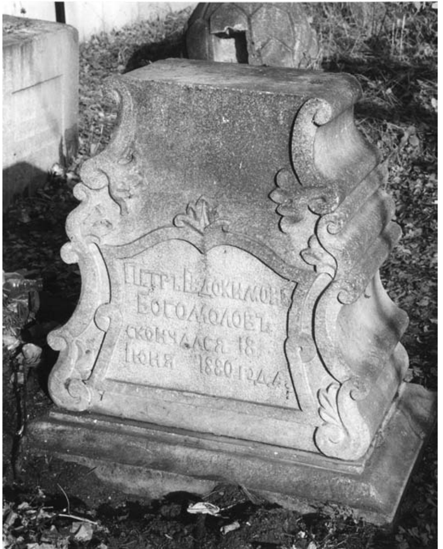
Надгробие на могиле П.Е.Богомолова.