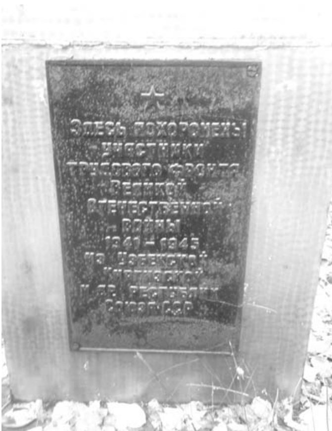
Надгробная плита на памятнике участникам трудового фронта.