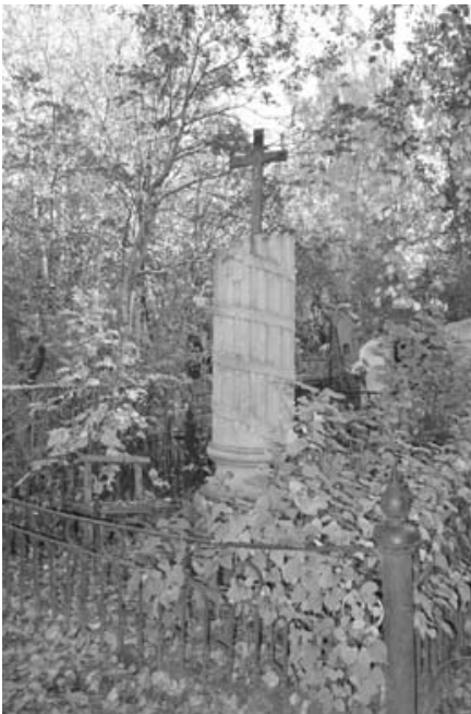
Надгробие на могиле А.В.Артюховой.