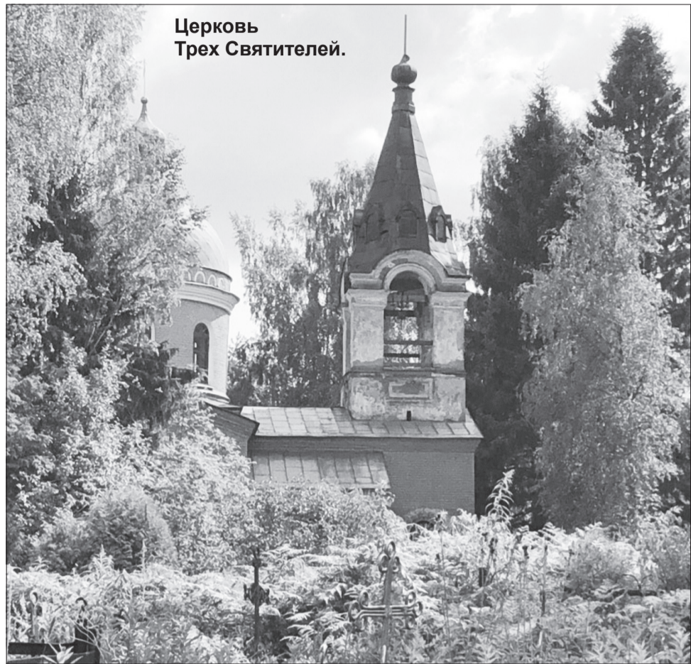
Церковь Трех Святителей.