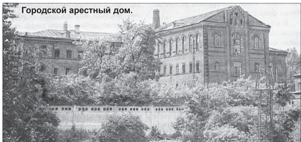
Городской арестный дом.