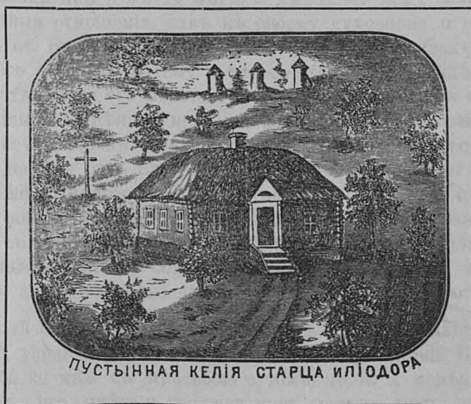
ПУСТЫННАЯ КЕЛІЯ СТАРЦА ИЛЮДОРА