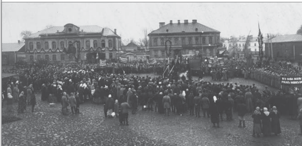
Тихвин. 1918 г. Демонстрация, посвященная 1-ой годовщине Октябрьской революции. (Надпись на транспаранте: «Вся наша жизнь в руках наших братьев»)

одна беда за другой: 8-9 сентября 20-30 человек солдат обокрали картофельный огород; 10 октября исполком потребовал отдать всех имеющихся лошадей в пользу угрозыска: «За неисполнение сего подвергнетесь строгой ответственности»; 11 октября появилось требование «отпускать в пользу больных города половину всего удоя» (в сентябре подотдел питания выяснял количество коров и молока); 19 октября подотдел питания запретил продажу капусты, картофеля и других овощей без его разрешения 62 .