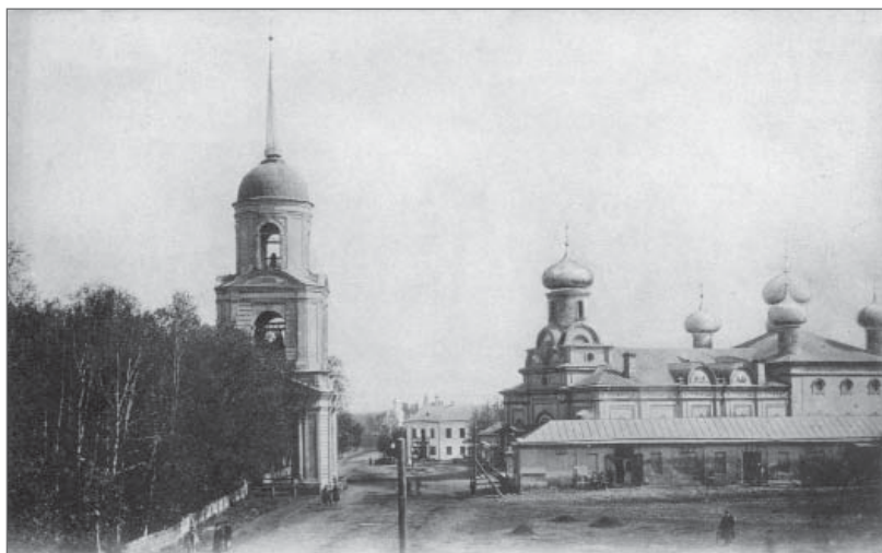
Тихвин. Спасо-Преображенский собор. Начало XX в.