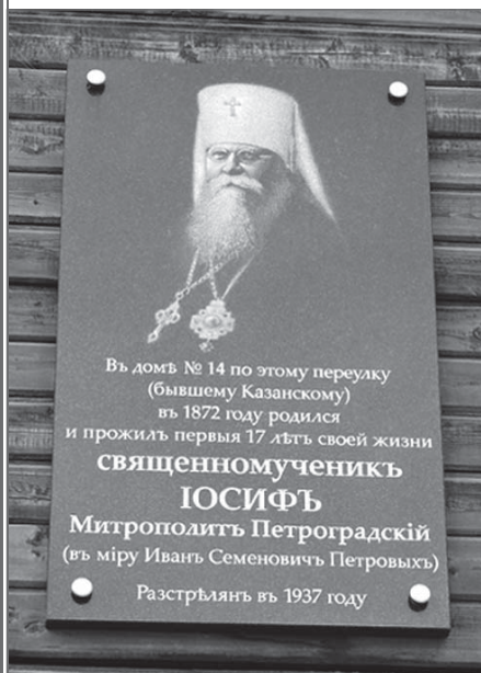
Устюжна. Мемориальная доска на доме митрополита Иосифа, где он родился и жил