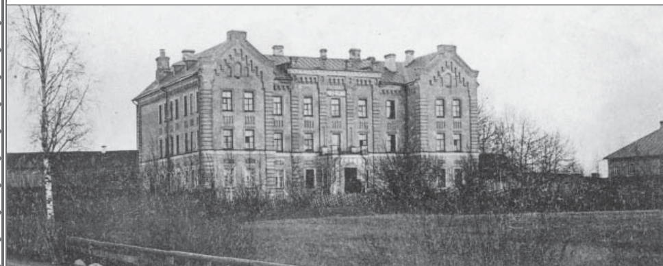
Тихвин. Духовное училище. Начало XX в.