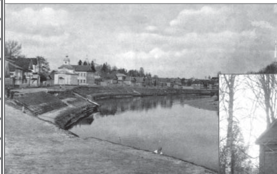
Тихвин. Набережная реки Тихвинки, на которой стоял дом Феофиловых. Начало XX в.