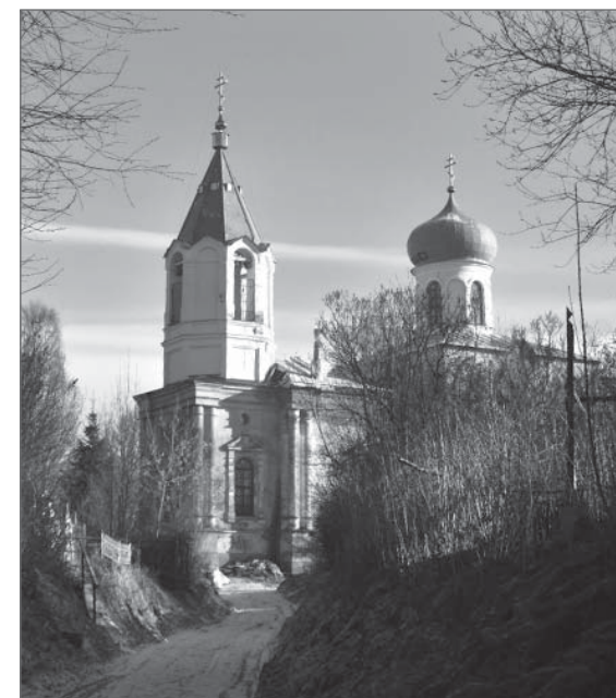
Тихвин. Церковь Иова Многострадального на старом кладбище