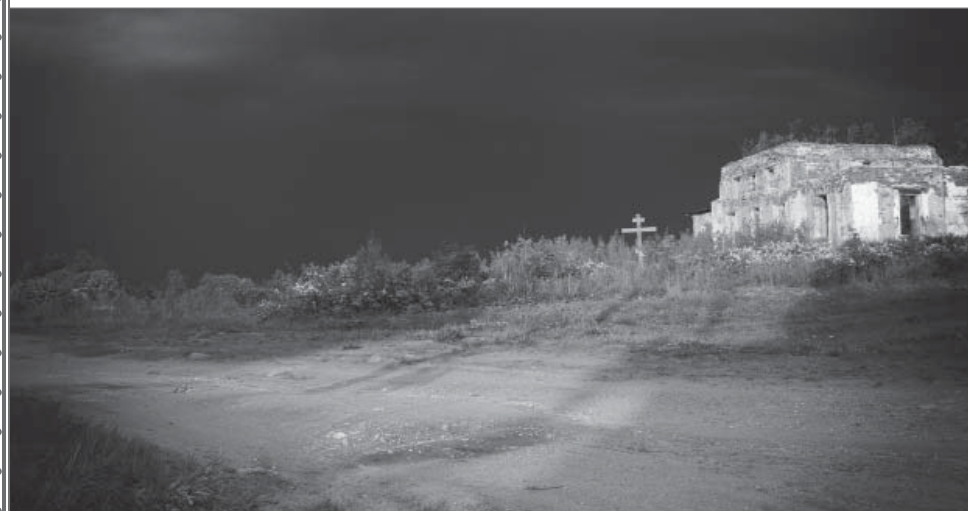
Большое Восное. Троицкая церковь. 2016 г.

В Большом Восном прошло всё детство Николая. Нельзя не упомянуть, что это село находилось всего в полутора десятках километров от исторической вотчины Тихвинского Введенского женского монастыря – села Никифорово с окрестными деревнями и пустошами, которые принадлежали обители в течение 150 лет.