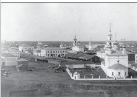
Устюжна. Торговая площадь. Конец XIX - начало XX в.