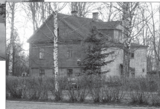
Дом Феофиловых. 2020 г.