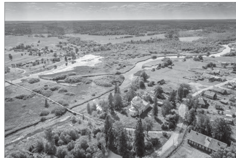
Озерёво. Церковь Святой Троицы. 2013 г.