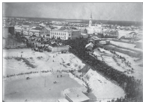
Устюжна. Крестный ход. 1910-е гг.