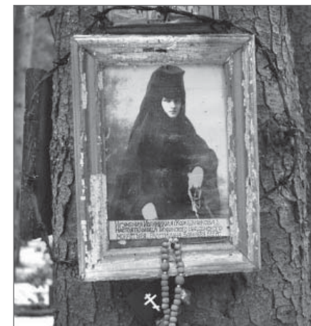
Фотография преподобномученицы Иоанникии на месте расстрела в Левашово