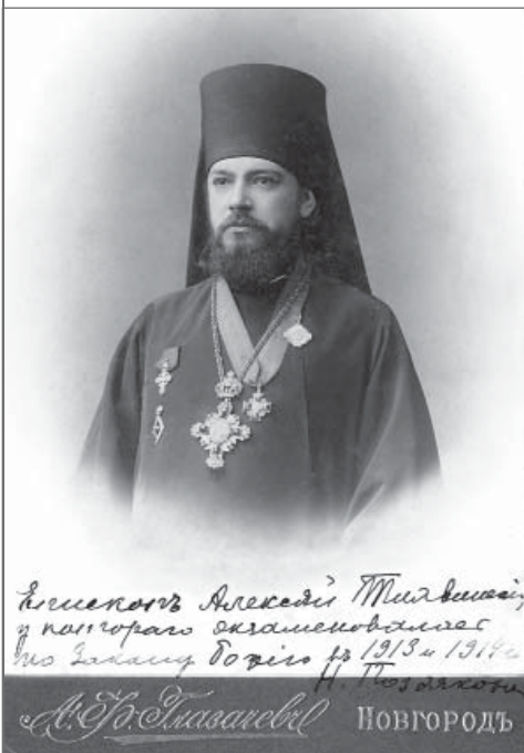
Епископ Тихвинский Алексий (Симанский). Начало XX в.