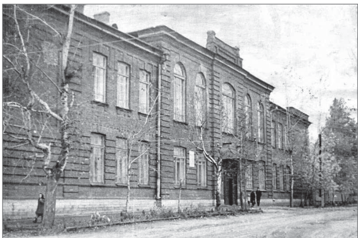
Тихвин. Женская гимназия. 1960-е гг. Из фондов ТИМАХМ

Учащимся негде было молиться, потому что собственного храма у гимназии тоже не было. Одни молились в чрезвычайной тесноте и давке в соборном храме, другие – в монастыре, третьи – в приходской церкви. В так называемые табельные дни учащиеся всех учебных заведений заполняли собой весь соборный храм города, стояли в духоте, некоторые из них даже падали в обморок. Вопрос о создании нормальных условий для молитвы поднимался неоднократно, но, как это часто бывает, «поговорят, поговорят, и забудут» 27 .