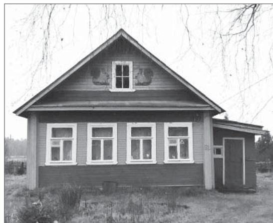
Здание бывшей школы в Кайваксе. 2019 г.