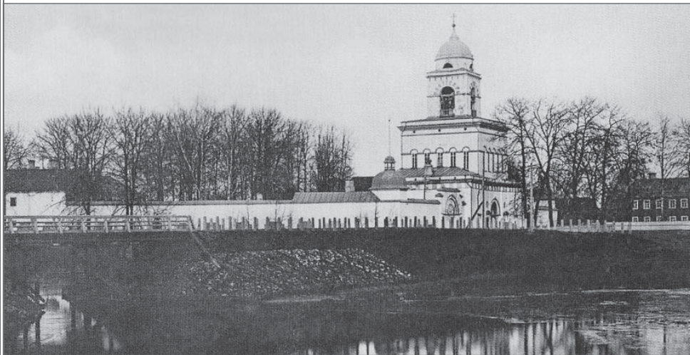
Введенский женский монастырь. Начало XX в.

Иоанна Новгородского и надвратная церковь великомученицы Екатерины и мученицы Августы. Должность настоятеля храмов монастыря на тот момент была вакантной.